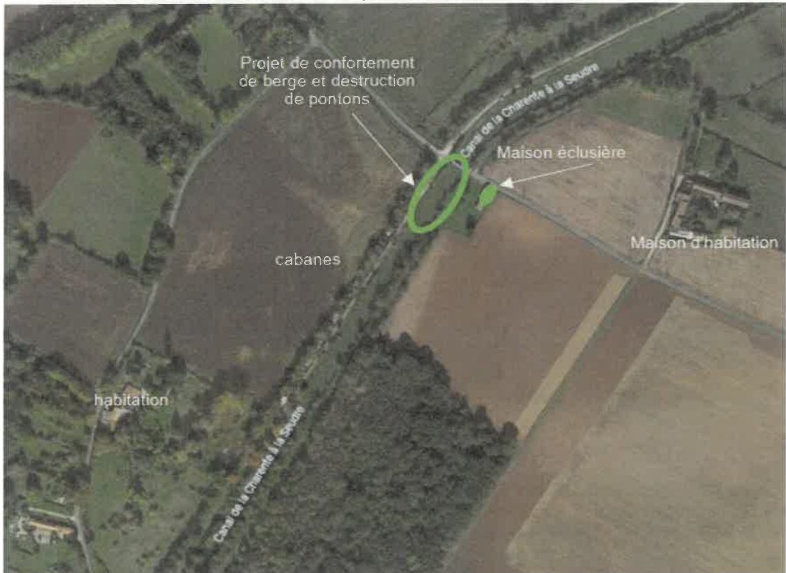
Localisation satellite et plan IGN de la zone du projet

Les travaux sont localisés sur la commune de Marennes-Hiers-Brouage, plus précisément sur la rive gauche du canal.